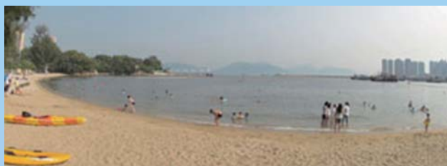
擁有藍天碧海的青山灣泳灘吸引泳客前來暢泳

➤ 自二零零五年重開以來，青山灣泳灘的水質繼續有所改善，而這情況可從泳灘每周等級反映出來。